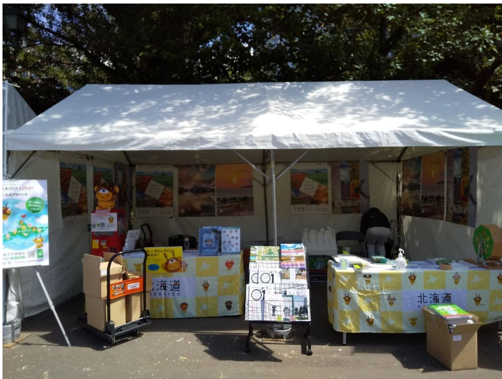
2022 年出展時のブース前景