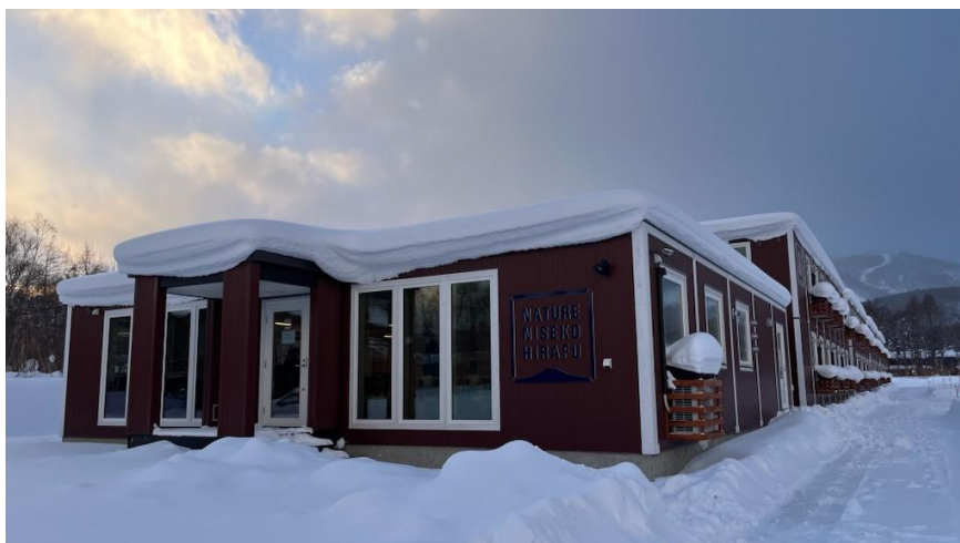
NATURE NISEKO HIRAFU