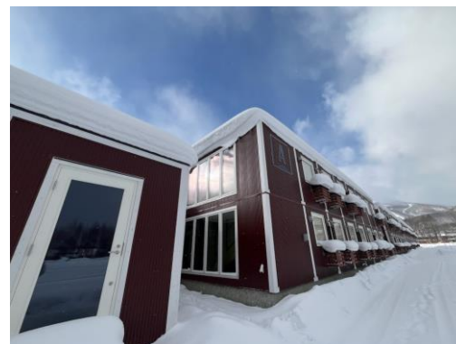
NATURE NISEKO HIRAFU A 棟