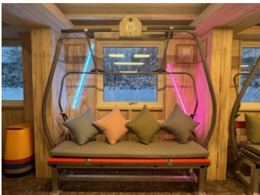
リフトをリメイクしたソファベンチ

また、株式会社 LMCU が提供する無人決済システムを活用した、ニセコ初の 24 時間レジレス完全無人売店「NATURE NISEKO HIRAFU スマートストア」を導入し、入居される就業者の生活をサポートいたします。