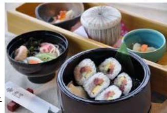
海鮮巻寿司ランチ